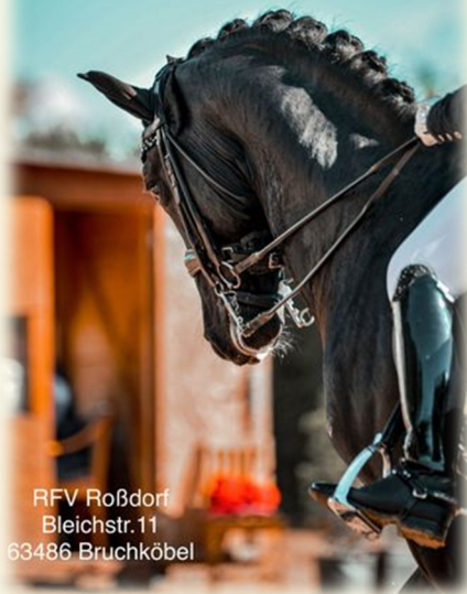
RFV Roßdorf Bleichstr.11 63486 Bruchköbel